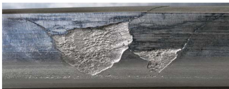
剥離部の接触応力過大が原因でない歯面損傷

お申込み頂きますと、請求書をお送りいたしますので、振り込み手数料を貴社ご負担の上、指定の銀行口座にお振込みください。公益財団法人応用科学研究所に入金が確認され次第、書籍を発送いたします。お問い合わせ窓口は応用科学研究所 総務部です。 (TEL 075-701-3164)