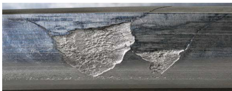
剥離部の接触応力過大が原因でない歯面損傷